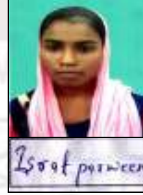
Photo and Signature