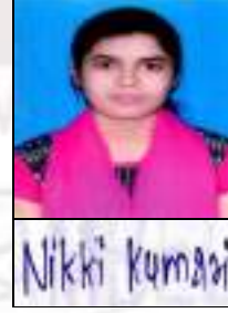
Photo and Signature