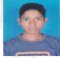
Photo and Signature